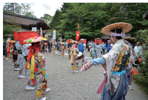
(草津市下笠のサンヤレ踊り)

なお、サンヤレ踊りと「近江のケンケト祭り長刀振り」の2件が、全国の風流踊り37件と合わせて、ユネスコ無形文化遺産に登録申請中で、2022年秋に審査が行われる予定となっています。